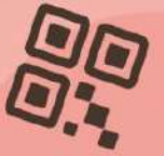
網路遊戲、交友軟體、QRcode