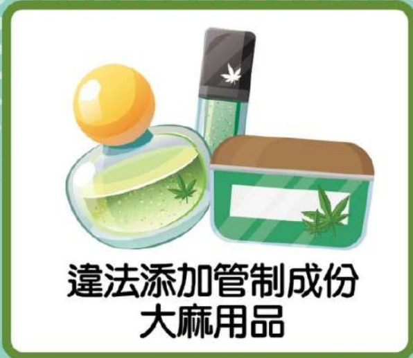
違法添加管制成份 大麻用品