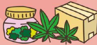
代購國外不明物品