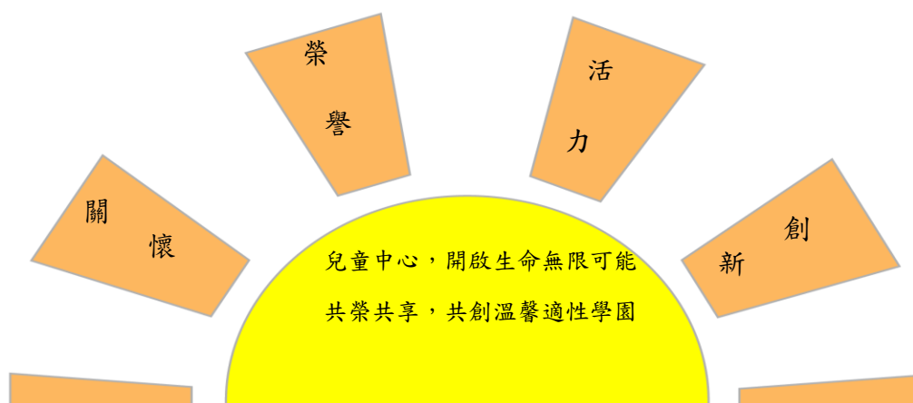
圖 1 臺北市東新國小願景圖